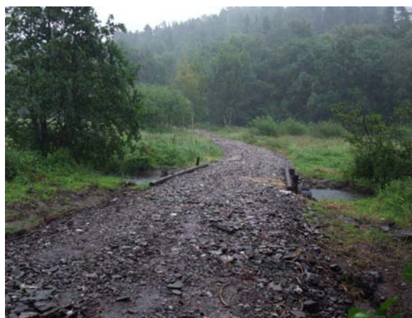
Under anleggsarbeidet.