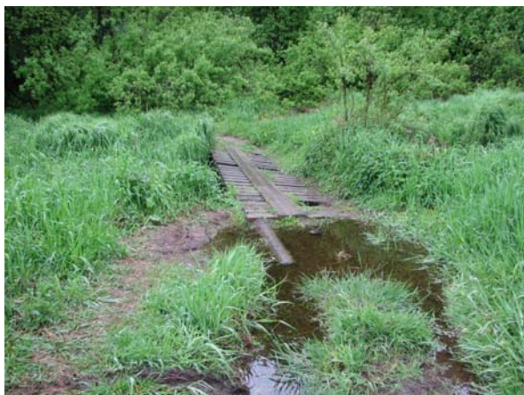
Før utbedring av bro over Biebekken.