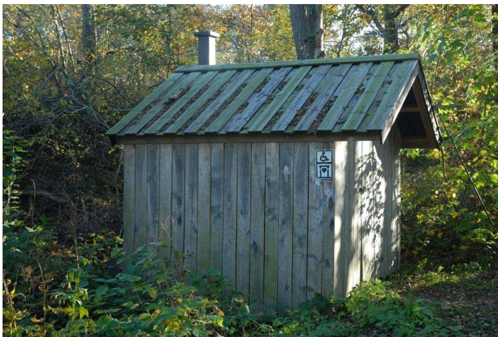
Eksempel på naturvennlig og universelt utformet toalett.