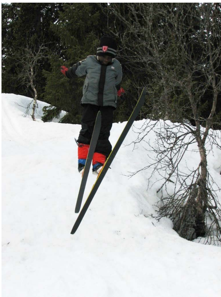
Skileik for alle.

Kommunedelplan for grønnstruktur i Arendal kommune og kommunedelplan for idrett / fysisk aktivitet, friluftsliv, folkehelse og kulturbygg 2009-2012 er svært sentrale i forhold til tilrettelegging for friluftsliv i kommunen. Handlingsprogrammet og tiltaksplanen i disse planene vil bidra til å sikre en helhetlig planlegging av turområder, der stier og løyper knyttes sammen med grøntdrag og andre adkomster til sti- og løypenettet.