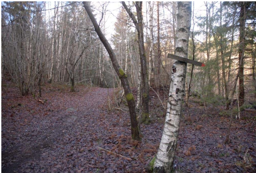
Eksempel på eksisterende skilting i Åsbieskogen.

Vurdering av behov: Tilrettelegging ved Utsikten og Doppedalen trenger jevnlig vedlikehold. Nye informasjons- og tilretteleggingstiltak i tilknytning til områdets mange kulturminner kan gjøre turområdet enda mer interessant for mange brukere.