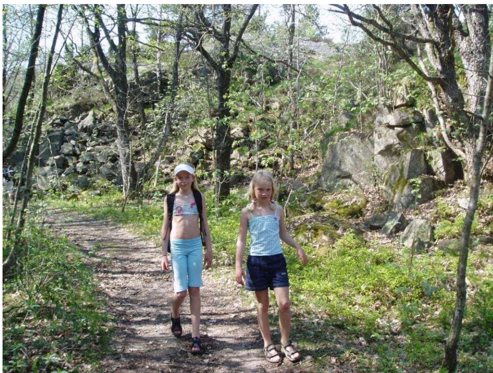
Friluftsliv gir folkehelse.