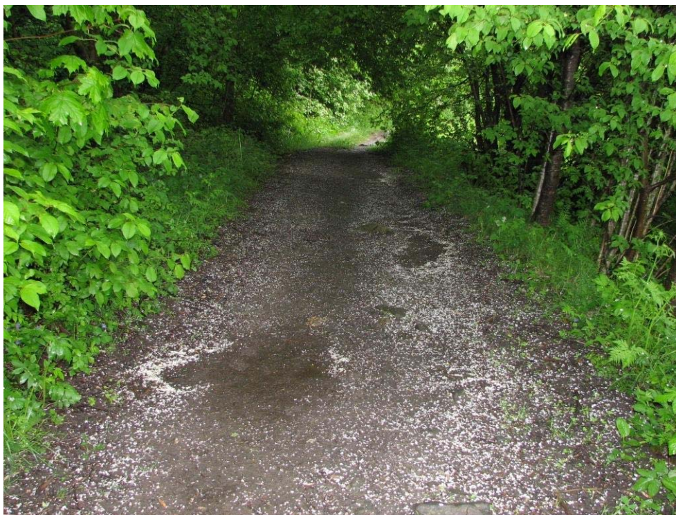
Turvei ved Biejordene.