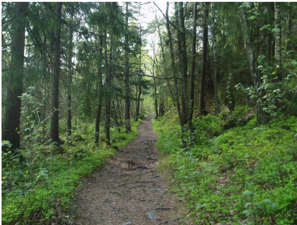
Turvei på Nedenes.