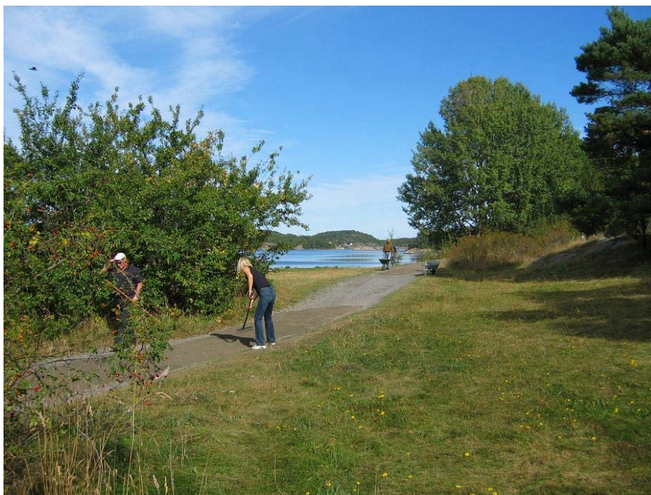
Hoves venner gjør en betydelig innsats.