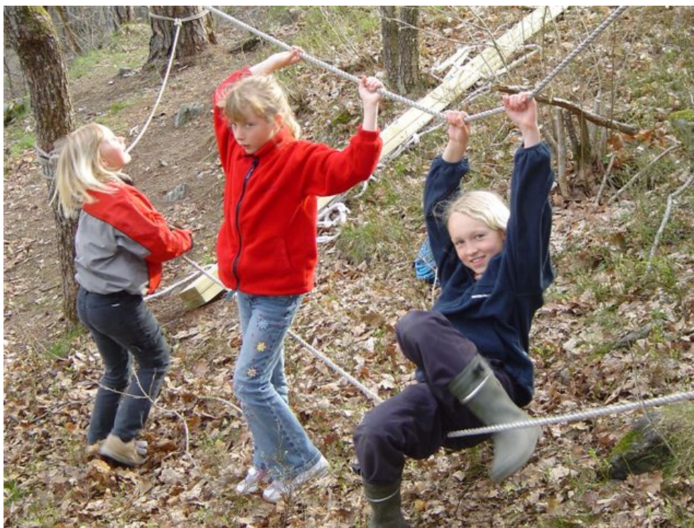
Eksempel på enkel triminstallasjon.

Vurdering av behov: I tilknytning til noen turområder eller hovedløyper kan det med fordel tilrettelegges for enkle natur- og barnevennlige triminstallasjoner, som for eksempel kan gi muligheter for balansetrening, armhevinger, ryggtrening med mer. Dette er svært vanlig som folkehelseiltak i andre land med stor befolkningstetthet og stor grad av tilrettelegging, og har nå blitt meldt inn som ønsket tilbud for barn og unge i Arendal kommune.