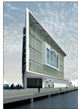
HAVNEGÅRDEN: Skisse: Asplan Viak AS blir også leietaker.