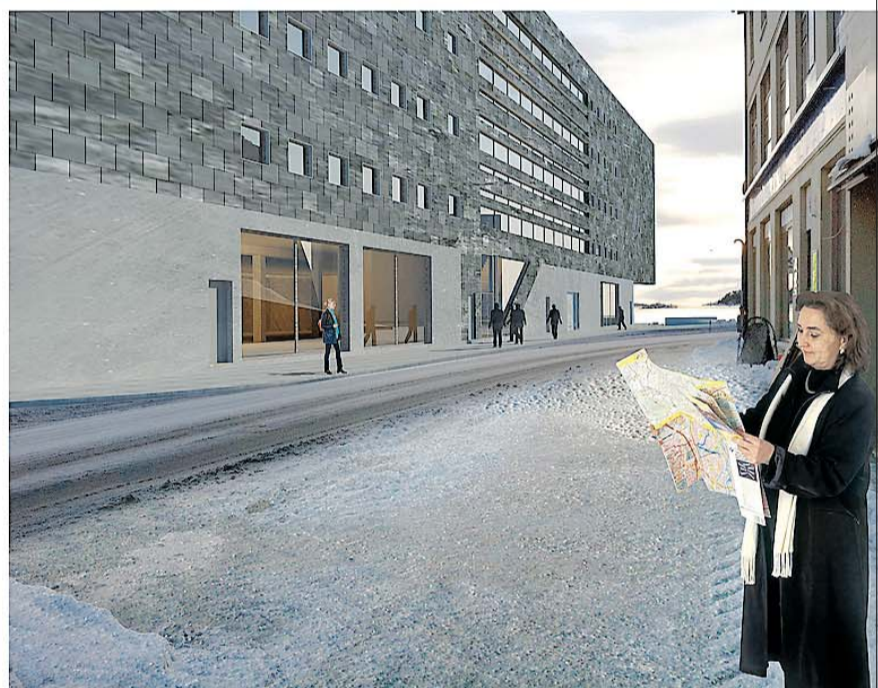
NYE FOTOMONTASJER: Her er de nye fotomontasjene av «Havnegården», på vestsiden av Barbu bukt. Nederst tv fra øst, nederst t.h. mot sør. SKISSE/MONTASJE: ASPLAN VIAK AS