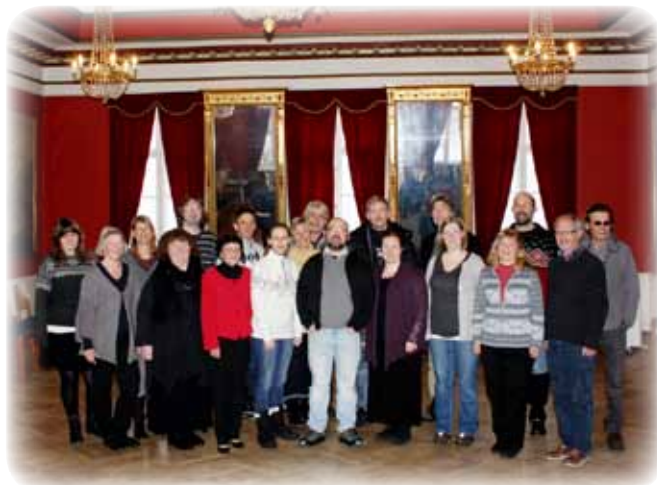
Deler av kulturskolens personale våren 2011

Skolen har ca. 600 elevplasser og ca. 16 årsverk fordelt på 30 lærere og dirigenter.