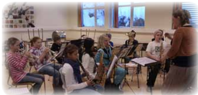
Juniororkesteret til Stinta skolemusikkorps.

Vitensenteret Sørlandet er hovedansvarlig for 3-dagerskurs som tilbys elever på 5. klassetrinn i høstferien 2011. Arendal kulturskole skal utvikle innholdet for en av dagene. Målsetting: Styrke kobling mellom kunst og realfag. Utviklingsprosjektet er støttet økonomisk av Utdanningsdirektoratet.