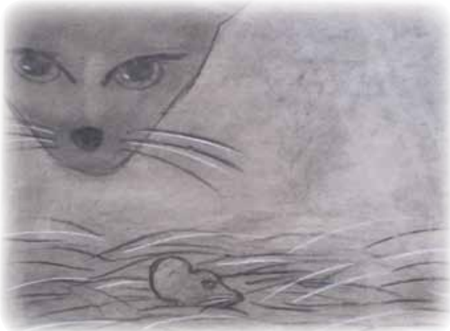
Bildet Katt og mus er tegnet av Anna Lofstad.