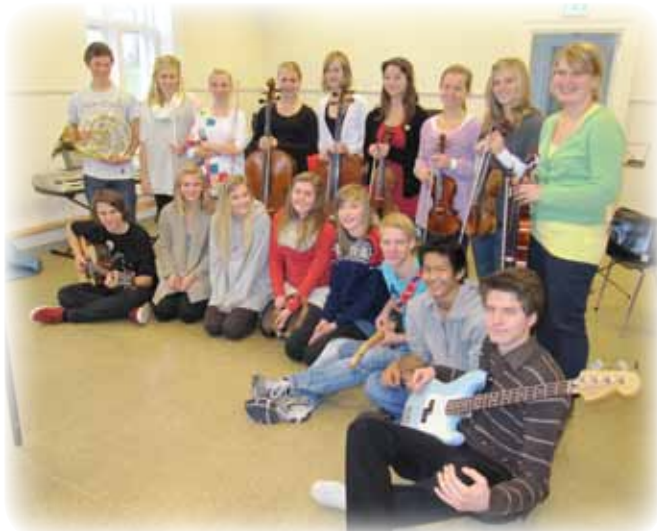
Lørdagsskolen våren 2011

Forankring i den enkelte kommune: Kommunene oppnevner et råd/gjennomføringskomité på tre medlemmer som, i tillegg til kulturskolens rektor og avdelingsleder, skal bidra til videreutvikling av talentutviklingsprogrammet. Norsk kulturskoleråd, Aust-Agder er et overordnet samarbeidsorgan for koordinering og oppnevning av rådsmedlemmer/gjennomføringskomité.